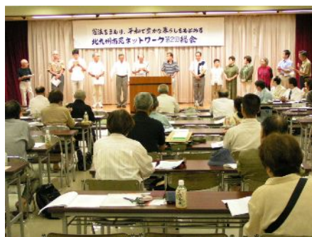
総会でリレー報告をする地域の会